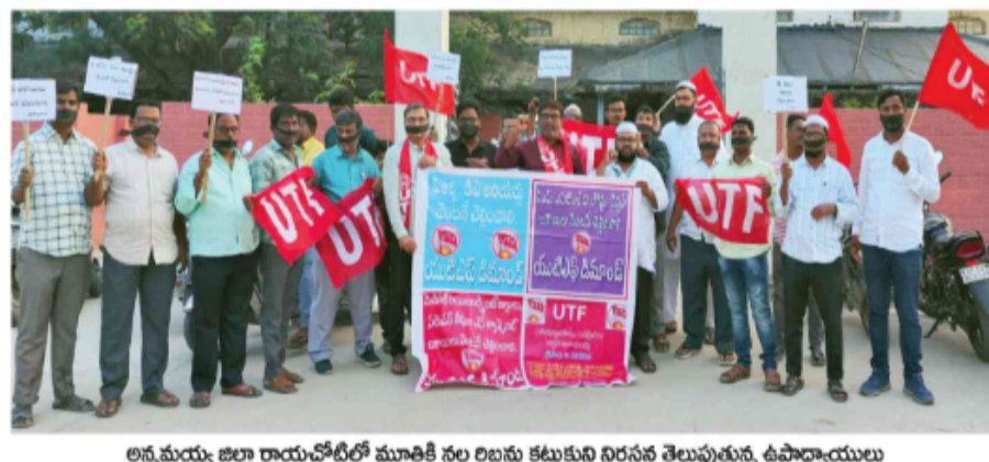
అన్నమయ్య జిల్లా రామచంద్రోల మూతికి నల్ల రిబ్బన్లు కట్టుకుని నిరసన తెలుపుతున్న ఉపాధ్యాయులు