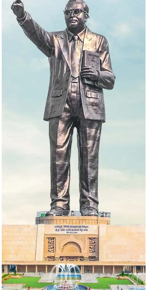
విజయవాడ: రాష్ట్రంలో బి.ఆర్. అంబేద్కర్ విగ్రహ ఆవిష్కరణ ముఖ్యమంత్రి వై ఎస్ జగన్మోహన్ రెడ్డి ద్వారా నికతతో, దేశ చరిత్రలో ఆంధ్ర రాష్ట్రం మరో నూతనాధ్యాయాన్ని లిఖించిందని