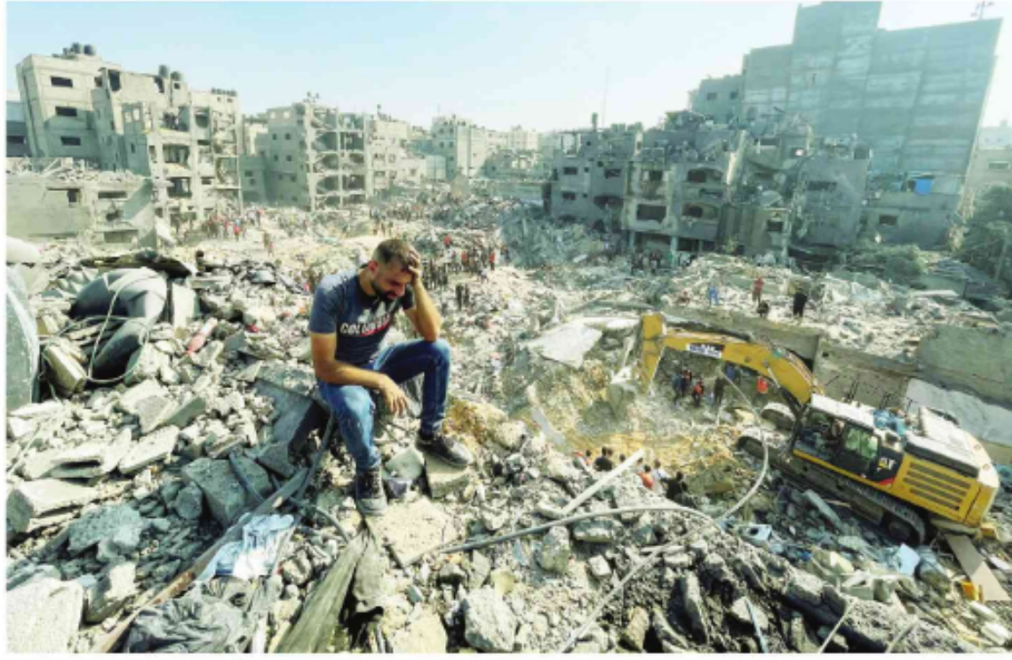
గాజాలో ఇజ్రాయెల్ జరిపిన క్రీవేగి దాడుల్లో దుంపలైన జబారియా శరణార్థి శిబిరం.. అంతులేని దుఖంతో తలవట్టుకున్న పాలస్తీనియన్ పౌరుడు

గాజా : గాజా సామూహిక సమాధిగా మారి అడివారానికి సరిగ్గా 100 రోజులు. ఇది ఈ శతాబ్దపు అత్యంత అమానవీయ చర్య. ఈ వంద రోజుల్లో 24వేల మంది దాకా పాలస్తీనియన్లు చనిపోయారు. మరో 60,000 మంది దాకా క్షతగాత్రులయ్యారు. చనిపోయినవారిలో ఎక్కువ భాగం ఆధునిక కుటుంబాలకు చెందిన వారు. మహిళలు, పిల్లలు, మహిళలే. ఆసుపత్రులు, క్రైస్తవ, ముస్లిం ప్రార్థనా స్థలాలను ధ్వంసం చేస్తూ యుద్ధ నేరాలకు పాల్పడుతున్న ఇజ్రాయెల్.. తాము గాజా నుంచి ఉపసంహరించుకునేందుకు సిద్ధంగా లేమని అంతర్జాతీయ న్యాయస్థానం ఎదుట చెప్పింది. అక్టోబర్ 7న హమాస్ దాడిని సాక్షుగా చూసి ఇజ్రాయెల్ ఎకవక్తంగా చేపట్టిన దురాక్రమణపూరిత దాడులు సాగిస్తోంది. గాజాలో రక్షణపరులు పారిపోయారు. యూదు ఉన్మాది నెతన్యాహు ఈ యుద్ధాన్ని ఆత్మ రక్షణ చర్యగా పేర్కొన్నారు. ఇజ్రాయెల్ ను యుద్ధ నేరస్థునిగా ప్రకటించాలని దక్షిణాఫ్రికా అంతర్జాతీయ న్యాయస్థానంలో పిటిషన్ వేసింది. 76 ఏళ్లుగా పాలస్తీనా ప్రజలు ఇజ్రాయెల్ దాడికాలకు, దురాక్రమణలకు గురవుతున్న ఉన్మాదాని దక్షిణాఫ్రికా ఆ పిటిషన్లో పేర్కొంది.