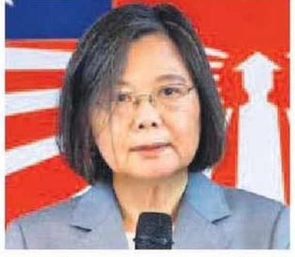
తైవాన్ అధ్యక్షురాలు త్సాయి ఇంగ్-వెన్

డెమోక్రటిక్ ప్రోగ్రెసివ్ పార్టీకి చెందిన త్సాయి ఇంగ్-వెన్ తైవాన్ అధ్యక్షురాలిగా ఎన్నికైన 2016 నుంచే చైనా ఆ దేశంపై దౌత్య పరమైన, సైనికపరమైన ఒత్తిడిని ప్రారంభించింది. తైవాన్ స్వతంత్ర దేశంగా ప్రకటించుకోవడంతోపాటు తమపై ఇతర దేశాల పెత్తనాన్ని నిరాకరించడం చైనాకు కంటగింపుగా మారింది. క్రమంగా తైవాన్ కు అడ్డంకులు సృష్టించడం ప్రారంభించింది. దీంతో ఏదో ఓ రోజున చైనా తైవాన్పై దురాక్రమణకు పాల్పడవచ్చును ఊహగానాలు మొదలయ్యాయి. సైబర్ దాడులతో చైనా ఆగిపోదని, ప్రపంచంతో తైవాన్ కున్న సంబంధాలను తెగ్గొట్టేందుకు ప్రయత్నించగలదని నిపుణులు అంచనా వేస్తున్నారు.