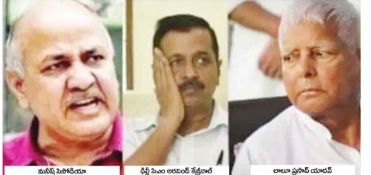
మనస్ సిసోడియా, ఢిల్లీ సీఎం అరవింద్ కేట్రవాలర్, లాలూ ప్రసాద్ యాదవ్

కేట్రవాలర్ జైలుకు వెళతారా? ఎత్తైక్ పాలన కేసులో అరెస్టు చేయబడిన ఇద్దరు సీనియర్ నేతలు... ఢిల్లీ మాజీ ఉప ముఖ్యమంత్రి మనస్ సిసోడియా, రాజ్యసభ ఎంపీ నంజయ్య సింగ్ ఇప్పటికే జైలులో ఉన్నారు. తాజాగా ఢిల్లీ సీఎం అరవింద్ కేట్రవాలర్ కు కూడా ఈడీ మూడుసార్లు సమస్య జారీ చేసింది. అయితే ఆయన విచారణకు హాజరయ్యేందుకు నిరాకరించారు. తనకు ఇచ్చిన సమస్య రాజకీయ ప్రేరేపితం, చట్టవిరుద్ధం అని విమర్శించారు. అమ్మ అడ్డీ పార్టీ (అసీ) కు కూడా ఈ కేసులో ఇరికించాలని దర్బాస్తు సంస్థలు భవిష్యే ఆ పార్టీ నేతలకు మరంత ఇబ్బందులు తలెత్తే అవకాశం ఉంది. ఈ కేసులో అరెస్టు కూడా నిందితుడిగా చేర్చాలని దర్బాస్తు సంస్థలు యోచిస్తున్నాయని కేంద్ర ప్రభుత్వ న్యాయవాది సుప్రీంకోర్టుకు తెలిపారు. మనీ లాండరింగ్ కేసుకు సంబంధించి ఈడీ దాఖలు చేసిన అనుబంధ ఛార్జిషీట్ను స్థానిక కోర్టు పరిగణనలోకి తీసుకుంది.