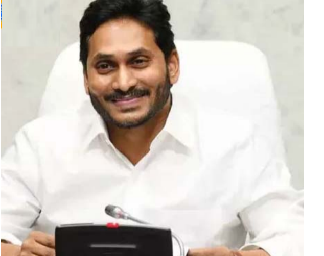
అమరావతి: ఆంధ్రప్రదేశ్ రాష్ట్ర ముఖ్యమంత్రి వైఎస్ జగన్ ప్రపంచ వ్యాప్తంగా ఉన్న తెలుగు ప్రజలకు సంక్రాంతి శుభాకాంక్షలు తెలిపారు. సంక్రాంతి అంటేనే అచ్చ తెలుగు పండుగ

అని ఆయన అన్నారు. ప్రతి గ్రామానికి శోభను తీసుకొచ్చే పండుగని మన సంప్రదాయాలు, సంస్కృతిని ప్రతిబింబించే పండుగ అని చెప్పారు. స్వగ్రామాలకు తిరిగి వెళ్లి, తమ కుటుంబ, సాంస్కృతిక మూలాలకు విలువనిచ్చే పండుగ అని అన్నారు. మన ప్రభుత్వం 56 నెలల్లోనే గ్రామ సచివాలయ వ్యవస్థ, వాలంటీర్ల వ్యవస్థ, హెల్త్ క్లినిక్ లు, రైతు భరోసా కేంద్రాలు, ఇంగ్లీషు మీడియం స్కూళ్లు, బ్రాడ్ బ్యాండ్ సదుపాయంతో అక్కడే కడుతున్న డిజిటల్ లైబ్రరీలు, ప్రతి పేద సామాజిక వర్గానికి చరిత్రలో ఎన్నడూ లేనంతగా అందిన లబ్ధి ఇవన్నీ పల్లెలు మళ్లీ కళకళలాడేందుకు ఎంతగానో ఉపయోగపడ్డాయని జగన్ తెలిపారు. నిన్నటి కంటే నేడు, నేటి కంటే రేపు, రేపటి కంటే భవిష్యత్తులో మరింత అభివృద్ధి సాధించగలం అనే భరోసా ఇవ్వగలిగితేనే ఇంటింటా సంక్రాంతి అని నమ్మి, ఆచరిస్తున్న ప్రభుత్వంగా రాష్ట్ర ప్రజలకు, ప్రపంచ వ్యాప్తంగా ఉన్న తెలుగు వారందరికీ మరక సంక్రాంతి శుభాకాంక్షలు అని జగన్ తెలిపారు.