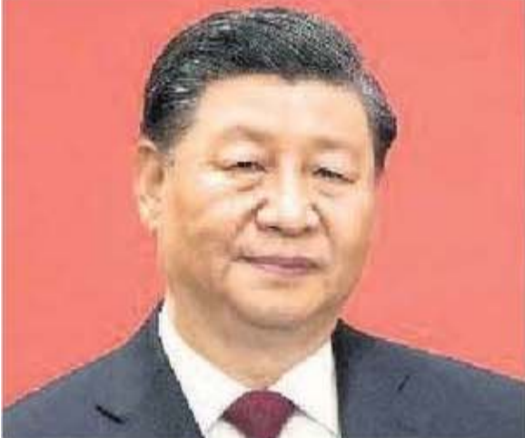
చైనా అధ్యక్షుడు జిన్ పింగ్

తైపీ, జనవరి 12: చైనాకు ద్వీపదేశంగా ఉన్న తైవాన్పై యుద్ధమేఘాలు ముసురుకుంటున్నాయి. తైవాన్లో శనివారం జరుగనున్న ఎన్నికల్లో వెలువడే ఫలితాల ఆధారంగా ఆ దేశ భవిష్యత్వం ఆధారపడి ఉంటుందని పరిశీలకులు అంచనా వేస్తున్నారు. తైవాన్ తన చెప్పుచేతుల్లోకి తీసుకోవాలని భావిస్తున్న చైనా ఇప్పటికే ఉచ్చ బిగుస్తున్నది. ద్వీపకల్పాన్ని అప్రదిగ్భంధనం చేసిన చైనా ఆ దేశ కమ్యూనికేషన్ నెట్వర్క్ను కూడా తమ స్వాధీనంలోకి తెచ్చుకున్నట్లు తెలుస్తున్నది. దీంతో తైవాన్లోని బ్యాంకులు మూతపడుతున్నాయి. ప్రజలు కోట్ల రూపాయల లావాదేవీలను ఆఫ్ లైన్లోనే నిర్వహిస్తున్నారు. తైవాన్ లోని ప్రపంచంలోనే అత్యంత అధునాతన సెమికండక్టర్ పరిశ్రమ స్తంభించిపోయింది. చైనా ప్రత్యక్షంగా తన సేనలను పంపడం తప్ప మిగిలిన అన్ని విధాలుగా తైవాన్ ను ఇబ్బందులకు గురి చేస్తున్నది. చైనా ప్రత్యక్షంగా దాడికి దిగితే ప్రపంచ ఆర్థిక వ్యవస్థకు రూ.828 లక్షల కోట్ల నష్టం జరుగుతుందని నిపుణులు అంచనా వేస్తున్నారు.