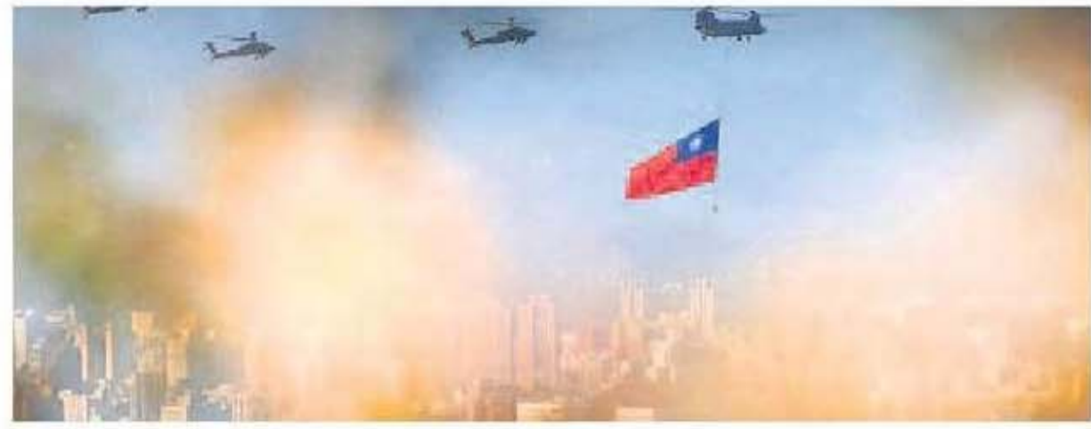
చైనా నుంచి ముప్పు పొంచి ఉండటంతో ఇటీవల తైపీ సమీపంలో ఆకాశంలో తైవాన్ జాతీయ జెండాను ఎగురవేస్తున్న ఆ దేశ సైనిక హెలికాప్టర్