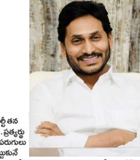
అన్ని కట్టో.. ఎన్నో కలలతో ఏపీలోని అధికార పార్టీ తన దూకుడు పెంచుతోంది. ప్రత్యర్థులకు అందనంత దూరం పరుగులు పెడుతోంది. ప్రజలను ఆకట్టుకునే ప్రచార సామగ్రిని సర్వసన్నద్ధం చేస్తోంది. ప్రజల మదిని కదిలించే వాగ్దాటికి అతనిరమైన మాటల తూటాలను సిద్ధం చేస్తోంది. తమ పార్టీ నాయకుడు వేదికపై సందించే పక్కలతో జనం ఉర్ధ్రాతలూగాలి. ఉత్సాహంతో కేరింతలు కొట్టాలి. ఇటీవల వైసీపీ నయా పూర్వం. ఇందులో మరీ ముఖ్యం ఇప్పటి వరకూ నవరత్నాల జల్లుతో జనాన్ని సమ్మోహన పర్చిన జగన్ పక్క ఇక అభ్యర్థి ఆరక మంత్రంతో జనాన్ని కదిలించుస్తూ తెలుస్తోంది. సర్వ జన సంక్షేమం, సర్వ జన సాధికారిత, సర్వ జన ఆరోగ్య సురక్ష ఫలి తాలను గుర్తు చేయటమే కాదు.. ఈ సారి అభ్యర్థుని తెర మీదకు తీసుకురానున్నారు. అటు సంక్షేమం, ఇటు అభ్యర్థికి పీటల వేసేది వైసీపీయే అని తెలిచేస్తున్నారు.

అసెంబ్లీ, ఎంపీ అభ్యర్థుల ఖరారు.. మార్పులు, చేర్పులు ఉంటే, తర్వాత నెల రోజుల్లో చేస్తారు. ఇతర మిదంగా జనవరి 20 నాటికి అభ్యర్థుల ఎంపికను పూర్తి చేస్తారు. ఇక, ఈలోగానే.. జనానికి ఇవ్వాలనే పథకాలు, చేయాలనే పనులను సమీక్షించి.. ఆయా పనులను పూర్తి చేయాలని జగన్ నిర్ణయించు కున్నారు. పార్టీ కీలక నాయకులు చెబుతున్నారు. పిఠాపర్తి రిచివర్ వారంలో ఓటాన్ అకౌంట్ ఇడైట్ కోసం అసెంబ్లీ సమావేశాలను నిర్వహిస్తారు. ఇవి మార్చి 5 నుంచి 10 లోపు జరుగుతాయి.. ఇక, ఆ తర్వాత ఎలాగో ఎన్నికల షెడ్యూల్ వస్తుంది. ఈ స్థితిలో.. జనవరి 21 నుంచి ఏ ఏ ఏ జగన్ పక్కా స్పెషల్ జనంలోకి దూసుకు పోతుంది.. సుడిగాలి పర్వటనలు, భారీ జనసభలు.. సమ్మోహన ప్రసంగాలు, చేర్పులు ఉంటే.. వచ్చే ఆ సెంటి, పార్లమెంటు ఎన్నికలకు పక్కా ప్రణాళికను రచించారు. అటువంటి సై అంటున్నారు. ఇప్పటికే అసెంబ్లీ నియోజకవర్గాల్లో అభ్యర్థుల పేర్లను ఖరారు చేసే ప్రక్రియను చేకవక నిర్వహిస్తున్నారు. జనవరి 10 నాటికి అభ్యర్థుల ఎంపిక పూర్తి కావటం తర్వాతనే సీఎం కేలక నేతలు చెబుతున్నారు. ఎంపీ అభ్యర్థుల ఎంపికను కూడా ఆయన పరిశీలిస్తున్నారు. ఏ తావాతా ఆట అసెంబ్లీ. ఇటు పార్లమెంటు ఎన్నికల్లో పోటీ చేయనున్న అభ్యర్థుల ఎంపిక ప్రక్రియను జనవరి 15 నుంచి 20 వరకు పూర్తి చేయనున్నారు. మార్పులు, చేర్పులు ఉండే చాన్స్ ఇక, ఎక్కడైనా సంక్షిప్త ప్రాంతాలు సూపర్ డీటీవీ, జనసేన కూటమి అభ్యర్థుల ఎంపిక