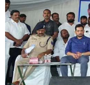
హైదరాబాద్: గతంలో కాంగ్రెస్ పంచిన భూములను బీఆర్ ఎస్ ప్రభుత్వం లాక్కుందని, తొమ్మిదేళ్లలో ఒక రేషన్ కార్డుకు దరఖాస్తు తీసుకోలేదని బీఆర్ఎస్ సర్కార్ పై దిప్పుటీ సీఎం, ఆర్థిక శాఖ

అమలు చేయడానికి చేస్తున్న కార్యక్రమం 'ప్రజాపాలన' అని తెలిపారు. కాంగ్రెస్ ది ప్రజల ప్రభుత్వం.. దొరల ప్రభుత్వం కానే కాదని స్పష్టం చేశారు. ప్రజల దగ్గరకే వెళ్లి దరఖాస్తులు స్వీకరిస్తున్నామని వెల్లడించారు. 'పంద కుటుంబాలకు ఒక కౌంటర్ పెట్టాలని అధికారులకు ఆదేశాలు ఇచ్చాం. ప్రజల చేత ప్రజల కోసం వచ్చిన ప్రభుత్వం మనది. ప్రజాపాలన అందిస్తామని చెప్పి ప్రజలను ఒప్పించి ప్రభుత్వం ఏర్పాటు చేశాం.