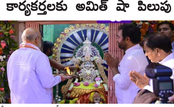
కార్యకర్తలకు అమిత్ షా పిలుపు

హైదరాబాద్: పార్లమెంట్ ఎన్నికల్లో 35 శాతానికి పైగా ఓట్లు సాధించి.. తెలంగాణ నుంచి 10 సీట్లను ప్రధాన మంత్రి నరేంద్ర మోదీకి బహుమతిగా ఇవ్వాలని కేంద్ర హోంశాఖ మంత్రి అమిత్ షా పిలుపునిచ్చారు. ఒక రోజు తెలంగాణ పర్యటనలో భాగంగా హైదరాబాద్ కు ప్రత్యేక విమానంలో విచ్చేసిన అమిత్ షా.. కొంగరకలాన్ లో నిర్వహించిన బీజేపీ విస్తృతస్థాయి సమావేశంలో ఈ వ్యాఖ్యలు చేశారు. గత అసెంబ్లీ ఎన్నికల్లో బీజేపీ తెలంగాణలో ఒక్క ఎమ్మెల్యే సీటు మాత్రమే సాధించింది. అయితే తాజా ఎన్నికల్లో 8 సీట్లతో మెరుగైన