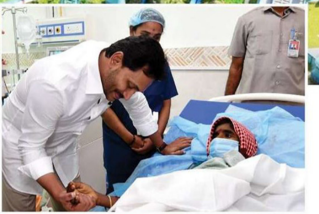
అభివృద్ధి, సంక్షేమ కార్యక్రమాలపై టీడీపీ, జనసేన నాయకులు ఏడుస్తున్నారు.. వ్యూకేజీ, మ్యారేజీ స్టార్ పార్టీకి తెలంగాణలో డిపాజిట్ కూడా దక్కలేదు - ఏపీ సీఎం జగన్మోహన్ రెడ్డి

ఉద్ధానంలో కిడ్నీ వ్యాధి సమస్య ఇప్పుడప్పుడే వచ్చింది కాదు.. కొన్ని దశాబ్దాలుగా ఈ సమస్య ఉన్నప్పటికీ అప్పటి చంద్రబాబు ప్రభుత్వం ఎందుకు నిరోధించే చర్యలు చేపట్టలేదని ఏపీ సీఎం జగన్ ప్రశ్నించారు. మాజీ సీఎం చంద్రబాబుకు మనసు లేదని, మమకారం లేదని ఈ విషయాన్ని ప్రజలు గుర్తించాలని కోరారు. సూపర్ స్పెషాలిటీ ఆసుపత్రి, కిడ్నీ రిసెర్చ్ కేంద్రాన్ని గురువారం సీఎం జగన్ ప్రారంభించారు. అనంతరం ఇండస్ట్రియల్ పార్కు, బాలుర వనతి గృహ నిర్మాణానికి శంకుస్థాపన చేశారు. అంతకుముందు సూపర్ స్పెషాలిటీ ఆసుపత్రిలోని వివిధ విభాగాలను పరిశీలించారు. అక్కడ కిడ్నీ వ్యాధిగ్రస్తులు, బాధితులను పరామర్శించారు. అనంతరం పలసం రైల్వే మైదానంలో జరిగిన బహిరంగ సభలో సీఎం జగన్ ప్రసంగించారు. (మిగతా 2లో..)