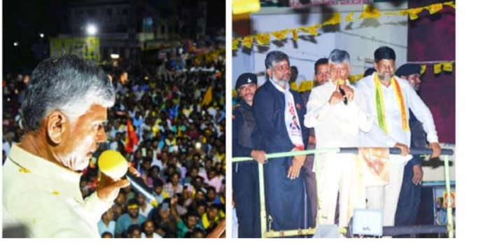
మంగళ హారతులు, జన జాతర, వంటలను పరిశీలిస్తున్న చంద్రబాబు, ప్రజల ఇబ్బందులు అడిగి తెలుసుకుంటున్న చంద్రబాబు

బాపట్ల, డిసెంబర్ 09, ప్రజా పాలన : నరేంద్ర వర్మను నమ్మం డి., అత్యధిక మెజార్టీతో గెలి పించండి.., భవిష్యత్తులో ఎటు వంటి ఇబ్బందులు లేకుండా చూసుకోగలిగిన ఉత్సాహం తుడు నరేంద్రవర్మ ఒక్క ముక్క లో చెప్పాలంటే.., నరేంద్ర వర్మ ఉంటే చంద్రబాబు ఉన్నట్లే. నేను ప్రజల కోసం ఎంత తపన పడతానో, అదే తపన నరేంద్ర వర్మలో కనిపిస్తుందని, బాపట్ల నియోజకవర్గ పరిధిలో ప్రజల కష్టసుఖాలను తెలుసుకొని వారికి అండగా నిలబడగలిగేది నరేంద్ర వర్మ ఒక్కరే. అని, తెలుగుదేశం పార్టీ అధినేత మాజీ సీఎం చంద్రబాబు నాయుడు బాపట్ల పర్యటనలో స్పష్టం చేశారు. మి.పి.సి. తుఫాన్ తో బాపట్ల పార్లమెంట్ పరిధిలో, అపార స్పష్టంతో కన్నీరు మున్నీరు అవుతున్న అన్నదాతలకు అండగా నిలిచేందుకు వారికి ధైర్యం కల్పించేందుకు, తెలుగు దేశంపార్టీ అధినేత, మాజీ ము ఖ్యమంత్రి నారా చంద్రబాబు నాయుడు, బాపట్ల నియోజకవర్గం పరిధిలో, తుఫాను ప్రభావంతో దెబ్బతిన్న పంటలను పరిశీలించారు. తెలుగుదేశం పార్టీ బాపట్ల నియోజకవర్గ ఇన్చార్జి హేగిన నరేంద్ర వర్మ ఆధ్వర్యంలో, మాజీ సీఎం చంద్రబాబుకు ఘన స్వాగతం లభించింది. కనీవినీ ఎయిగని రీతిలో ఇనుక వేస్తే రాలనంత జనం చంద్రబాబును చూసేందుకు తరలివచ్చారు. అసంతోరం నియోజక వర్గంలో పలు ప్రాంతాల్లో పర్యటించి, వంటలను పరిశీలించి రైతు లను ఓదార్చారు. ఈ సందర్భంగా మాజీ సీఎం చంద్ర బాబు మాట్లాడుతూ, ఉల్లిగడ్డ కు , అలుగడ్డకు తేడా తెలియ ని సీఎం జగన్ కు రైతుల కష్టాలు ఎలా తెలుస్తాయన్నారు. ప్రకృతి వైపరీత్యానికి, ప్రభుత్వ తప్పిదం తోడవడం వల్ల, రైతు కు అపార స్పష్టం జరిగిందన్నారు. ఎకరానికి రూ.50,000 నష్టపరిహారం చెల్లించాలని ప్రభుత్వాన్ని డిమాండ్ చేశారు. లేకపోతే మూడు నెలల్లో, తా ము అధికారంలోకి వచ్చాక ఆ పరిహారాన్ని అందజేస్తామని చంద్రబాబు స్పష్టం చేశారు.