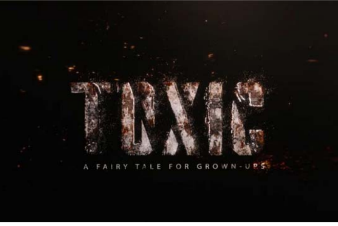
చిత్రంపై ఓ ఇంట్రెస్టింగ్ టైటిల్ టీజర్ ని స్ట్రయింగ్ బ్యాక్గ్రౌండ్ సోర్స్ తో రివీల్ చేస్తూ ఈ సినీమా టైటిల్ ని "టాక్సిక్" అంటూ రివీల్ చేయగా ఇందులో యష్ లుక్ కూడా ఎలా ఉంటుంది అనేది హిట్ ఇచ్చారు.

కన్నడ రాకింగ్ స్టార్ యష్ హీరోగా నటించిన గత చిత్రాలు కేజీయస్ సిరీస్ హిట్ అయ్యిన తర్వాత తన నెక్ట్ ప్రాజెక్ట్ ఏంటి ఎవరితో అనేది చాలా కాలం సస్పెన్స్ గానే ఉంది. మరి ఈ చిత్రం మోస్ట్ అవైటెడ్ గా మారిన ఈ బిగ్గెస్ట్ ప్రాజెక్ట్ పై మేకర్స్ ఇప్పుడు సాటిడ్ అనౌన్స్మెంట్ తో భారీ అప్డేట్ రివీల్ చేశారు. ఈ చిత్రం టైటిల్ సహా రిలీజ్ డేట్ ని కూడా లాక్ చేసేసి ఫ్యాన్స్ కి అదిదే ట్రీట్ ఇచ్చారు. ఇక ఈ భారీ