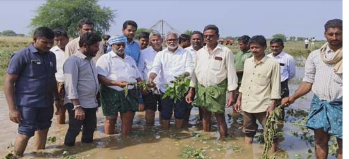
అడుకుంటుందని స్పష్టం చేశారు ఈ కార్యక్రమాల్లో స్థానిక ప్రజాప్రతినిధులు, అధికారులు, ఆయా గ్రామాల రైతులు, వైయస్ఆర్ కాంగ్రెస్ పార్టీ నాయకులు, కార్యకర్తలు, తదితరులు పాల్గొన్నారు