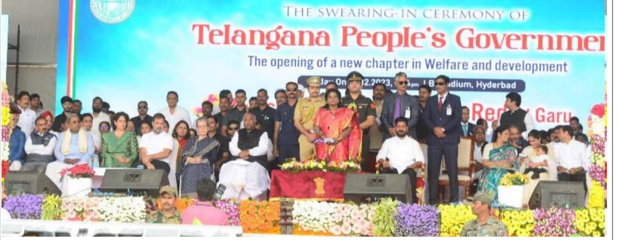
ప్రమాణస్వీకారోత్సవానికి హాజరైన అతిథిరథమహారథులు..