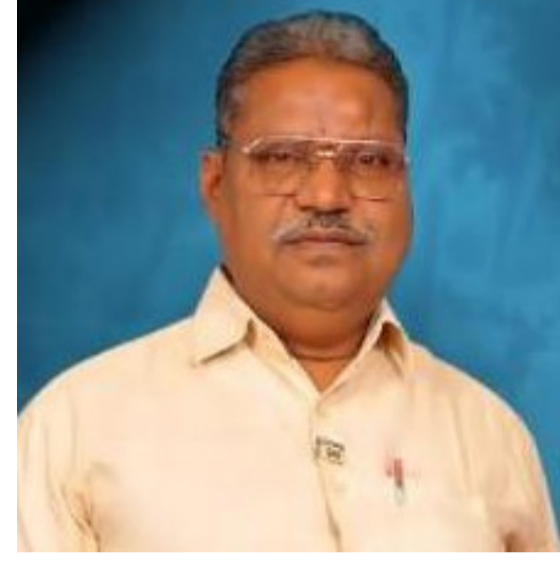
విజయవాడ (ప్రజాపాలన ప్రతినిధి): అయిదు కోట్ల జనాభా ఉన్న ఆంధ్రప్రదేశ్ రాష్ట్రాన్ని పాలించడానికి అవినీతి చరిత్ర లేని నాయకుడే దొరకడం లేదా అని ప్రశ్నించారు ఆల్ తెలుగు