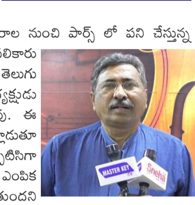
ఆల్ తెలుగు ప్రజా పార్టీ - ATPP

విజయవాడలో జరిగే సమావేశంలో ఎంపీటీసీగా, జిల్లాటీసీగా, ఎంపీగా, ఎమ్మెల్యేగా, ఎంపీగా, పోటీ చేసే అభ్యర్థుల ఎంపిక మరియు పార్టీ పదవుల ఎంపిక సెలక్షన్ జరుగుతుందని తెలిపారు. పోటీ చేసే నాయకులు, పార్టీ పదవులు కోరుకునే వారు, వారి మద్దతుదారులతో పెద్ద ఎత్తున సమావేశానికి హాజరు కావాలని ఆయన కోరారు. పార్టీ విధి విధానాలతో పాటు పోటీ చేయనున్న అభ్యర్థుల ఎంపిక ఆ సమావేశంలోనే చేయనున్నట్లు ఆయన తెలిపారు.