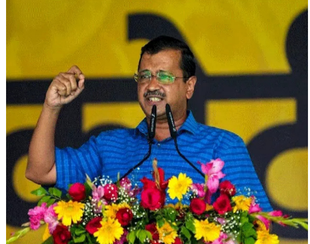
రోడ్షోలో ఆయన మాట్లాడుతూ ఢిల్లీ, పంజాబ్లో ఆప్ ను ఆదరించిన తరహాలోనే మధ్యప్రదేశ్ లోనూ తమ పార్టీకి ప్రజలు పట్టం కడతారని ఆశాభావం వ్యక్తం చేశారు. మధ్యప్రదేశ్ అసెంబ్లీ ఎన్నికల ఫలితాలు వెల్లడయ్యే నాటికి తాను జైల్లో ఉంటానో.. మరెక్కడ ఉంటానో తెలియదని, అయితే సింగ్ గౌరీ లిక్ కేజ్రీవార్ వచ్చారు. తాము ఆయనకు చారిత్రక విజయం అందించామని ప్రతి ఒక్కరూ చాటిచెప్పాలని ఆయన పిలుపు ఇచ్చారు. లిక్కర్ స్కాంలో వలపురు ఆప్ నేతలు, మంత్రులపై కేంద్ర దర్యాప్తు సంస్థలు తీవ్ర చర్యలు చేపట్టిన నేపథ్యంలో కేజ్రీవార్ జైలు గురించి ప్రస్తావించారు. ఇదే కేసులో ఢిల్లీ మాజీ డిప్యూటీ సీఎం మనీష్ సిసోడియా, ఆప్ రాజ్యసభ ఎంపీ సంజయ్ సింగ్ ఇప్పటికే జైలులో ఉన్నారు.

భోపాల్ : మధ్యప్రదేశ్ అసెంబ్లీ ఎన్నికల ప్రచారంలో భాగంగా రోడ్షోలో పాల్గొన్న ఢిల్లీ సీఎం అరవింద్ కేజ్రీవార్ గురువారం కీలక వ్యాఖ్యలు చేశారు. లిక్కర్ స్కాంలో ఈరోజు ఈడీ ఎదుట విచారణకు హాజరు కావాల్సిన కేజ్రీవార్ మధ్యప్రదేశ్ ఎన్నికల ప్రచారంలో పాల్గొన్నారు. అసెంబ్లీ ఎన్నికల ఫలితాలు వెల్లడయ్యే నాటికి తాను జైల్లో ఉంటానో.. బయట ఉంటానో తనకు తెలియదని వ్యాఖ్యానించారు. అయితే తనకు జైలంటే భయం లేదని కేజ్రీవార్ స్పష్టం చేశారు. సింగ్ గౌరీలో జరిగిన