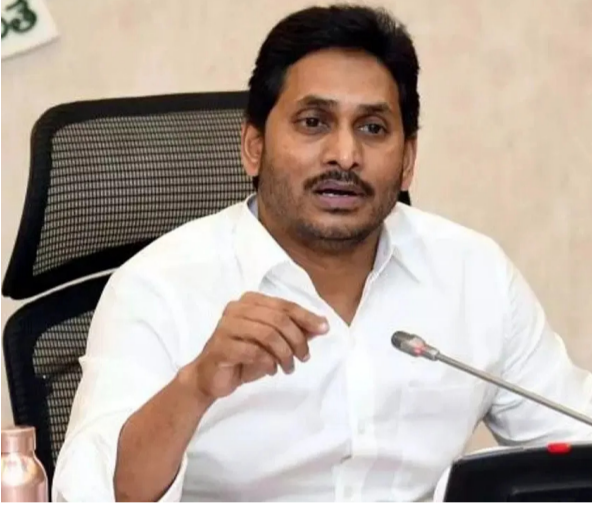
అధ్యక్షులు, జెడ్పీసీ సభ్యులు, ఎంపీపీలు, మండల పార్టీ అధ్యక్షుల వరకు 8 వేల మందికిపైగా ప్రతినిధులు పాల్గొన్నారు. ఈ సందర్భంగా

అమరావతి: అసెంబ్లీ ఎన్నికల సమయం దగ్గర పడుతున్న నేపథ్యంలో ఏపీలో ఆయా పార్టీలు దూకుడు పెంచాయి. ఇక అధికార పార్టీ వైసీపీ పూహలు రచిస్తోంది. ముఖ్యమంత్రి వైఎస్ జగన్ మంత్రులు, ఎమ్మెల్యేలు, కార్యకర్తలకు పలు సూచనలు చేస్తున్నారు. సోమవారం విజయవాడ ఇందిరా గాంధీ మున్సిపల్ స్టేడియంలో పార్టీ విస్తృతస్థాయి సమావేశం జరిగింది. ఈ సమావేశంలో ఎంపీలు, ఎమ్మెల్యేలు, ఎమ్మెల్యేలు, నియోజకవర్గాల ఇన్చార్జ్లు, ప్రాంతీయ సమన్వయకర్తలు, జిల్లా పార్టీ