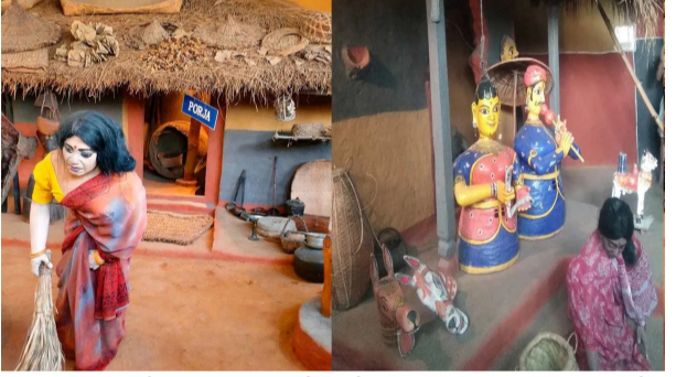
శంకుస్థాపన చేయనున్నారు. దీంతోపాటుగా మసఖ్ ట్యాంకులో వందశాతం కేంద్ర ప్రభుత్వ నిధులతో రూ. 6.5 కోట్లు నిర్మాణం పూర్తిచేసుకున్న గిరిజన పరిశోధనా సంస్థ ట్రైబల్ రీసెర్చ్

హైదరాబాద్, అక్టోబర్ 8: హైదరాబాద్ నడిబొడ్డున ఉన్న ఆబిడ్స్ లో 0.75 ఎకరాల్లో రాంజీ గోండు స్మారక గిరిజన స్వాతంత్ర్య సమర యోధుల మ్యూజియంకు సోమవారం (అక్టోబర్ 9) కేంద్ర గిరిజన సంక్షేమ శాఖ మంత్రి అర్జున్ ముండా, కేంద్ర సాంస్కృతిక శాఖ మంత్రి, బీజేపీ రాష్ట్ర అధ్యక్షుడు జి కిషన్ రెడ్డి