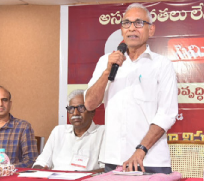
అమరావతి బ్యూరో : పేదలకు న్యాయం జరగాలంటే అసమానతలు లేని అభివృద్ధి కావాలని, రాష్ట్రంలో కొద్దికాలంగా పాలన పేరుతో అస్తల లూటీ, నిధుల దోపిడి యధేచ్ఛగా సాగుతోందని,

సంపుటి 16 సంచిక 46 విశాఖపట్నం ఆదివారం 08 అక్టోబరు 2023 8 పేజీలు వెల : 5.00