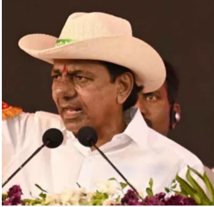
హైదరాబాద్, : తెలంగాణలో ఎన్నికలకు ముహూర్తం సమీపిస్తోంది. మ్యూనిసిపాలిటీల మేనియాకు ఆసక్తితో ఏ పార్టీ ఏం ప్రకటిస్తుంది? అని వేచిచూస్తున్నారు. ఈ క్రమంలో అన్ని పార్టీలు ఎన్నికల