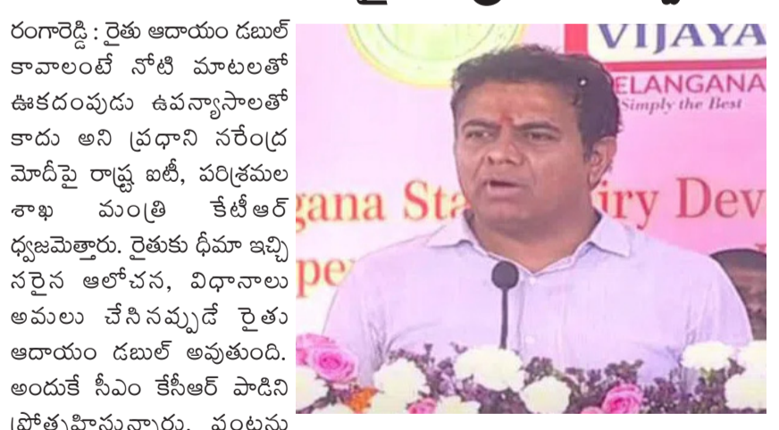
రంగారెడ్డి: రైతు ఆదాయం డబ్బల్ కావాలంటే నోటి మాటలతో ఊకదంపుడు ఉపగ్రామాలతో కాదు అని ప్రధాని నరేంద్ర మోదీపై రాష్ట్ర ఐటీ, పరిశ్రమల శాఖ మంత్రి కేటీఆర్ ధ్వజమెత్తారు. రైతుకు ధీమా ఇచ్చి సరైన ఆలోచన, విధానాలు అమలు చేసినప్పుడే రైతు ఆదాయం డబ్బల్ అవుతుంది. అందుకే సీఎం కేసీఆర్ పాడిని ప్రోత్సహిస్తున్నారు. వంటను ప్రోత్సహిస్తున్నారు. మినీ డెయిరీలను పెద్ద ఎత్తున ఎంకేజీ చేస్తున్నాం అని మంత్రి కేటీఆర్ తెలిపారు. రంగారెడ్డి జిల్లా మహేశ్వరం నియోజకవర్గం పరిధిలోని రావిర్యాల వద్ద దేశంలోనే అత్యాధునిక, ఆటోమేషన్ ప్రాసెసింగ్ టెక్నాలజీతో నిర్మించిన విజయ మోగా డెయిరీని మంత్రులు తలసాని శ్రీనివాస్ యాదవ్, సబితా ఇంద్రారెడ్డితో కలిసి మంత్రి కేటీఆర్ ప్రారంభించారు. ఈ మోగా డెయిరీని 40 ఎకరాల విస్తీర్ణంలో రూ. 250 కోట్లతో నిర్మించారు. రోజుకు లక్ష లీటర్ల టెట్రా బిక్ పాల ఉత్పత్తి చేసేలా మిషనరీ ఏర్పాటు చేశారు. ఈ సందర్భంగా అక్కడ ఏర్పాటు చేసిన సభలో పాడి రైతులను ఉద్దేశించి మంత్రి కేటీఆర్ ప్రసంగించారు. తెలంగాణలో తప్ప ఇతర రాష్ట్రాల్లో రైతుల కష్టాలు డబ్బల్ ప్రధాని నరేంద్ర మోదీ 2014లో ఒక మాట చెప్పారు.. అదేంటంటే 2022 నాటికి రైతుల ఆదాయం డబ్బల్ చేస్తానన్నాడని కేటీఆర్ గుర్తు చేశారు. రైతుల ఆదాయం డబ్బల్ అయిందా? అని ప్రశ్నించారు. తెలంగాణ రాష్ట్రంలో తప్ప ఇతర రాష్ట్రాల్లో రైతుల కష్టాలు డబ్బల్ అయ్యాయి. ఇతర రాష్ట్రాల్లో రైతుబంధు, రైతుబీమా, 24 గంటల కరెంట్ ఇవ్వలేని దుస్థితి నెలకొని ఉందని కేటీఆర్ తెలిపారు. మోదీ చెప్పినట్లు రైతుల ఆదాయం డబ్బల్ అయినా, కాకపోయినా.. తెలంగాణలో మాత్రం కేసీఆర్ నాయకత్వంలో పాడి రైతులకు గానీ, ఇతర రైతులందరికీ న్యాయం జరుగుతుంది. (మిగతా 2లో..)