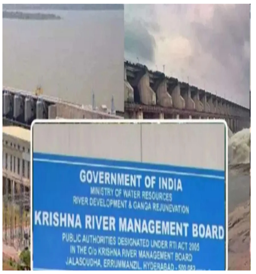
హైదరాబాద్: ఆంధ్రప్రదేశ్ కృష్ణా నది యాజమాన్య బోర్డుకు ఫిర్యాదు చేసింది. ఏపీ అక్రమంగా రాయలసీమ ఎత్తిపోతల పనులు చేపట్టిందంటూ కేఆర్ఎంబీకి తెలంగాణ రాష్ట్ర సీనియర్ల ద్వారా ఈఎన్సీ మురళీధర్ లేఖ రాశారు. నేషనల్ గ్రీన్ ట్రిబ్యూనల్ ఆదేశాలను ధిక్కరించి.. ఏపీ పనులను కొనసాగిస్తోందన్నారు. కృష్ణా బేసిన్ వెలుపలకు నీటిని తరలించే పనులు ఏపీ చేపడుతుందని, 59 టీఎంసీల నీటిని తరలించేలా పనులు కొనసాగిస్తోందని ఈఎన్సీ లేఖలో ప్రస్తావించారు. అంతరాష్ట్ర ఒప్పందాలకు విరుద్ధంగా ఏపీ వ్యవహరిస్తోందని, పనులు కొనసాగితే తెలంగాణ ప్రాజెక్టులకు భారీగా నష్టం జరుగుతుందని ఈఎన్సీ తెలిపారు. తక్షణమే స్తుంది ఏపీ చేపడతున్న పనులను నిలిపివేయించాలని కోరారు.