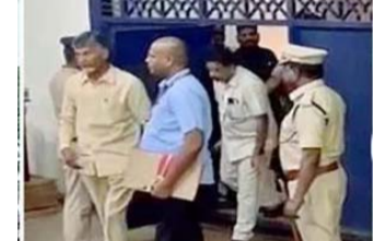
చంద్రబాబు రిమాండ్ గడువు ఈనెల