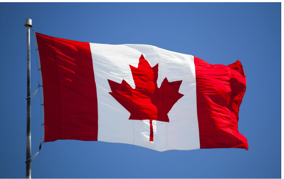
కానీ.. వాటిని ట్రూడో చూపించడం లేదు. ఈ తరుణంలో భారత్ తో స్నేహగీతం కోసం ఆయన ప్రయత్నిస్తుండటం చర్చలకు దారితీసింది. భారత్ తో మంచి సంబంధమే కావాలి. కానీ కెనడా దేశంలో కూడా కొన్ని చట్టాలు ఉంటాయి. అసలు నిజాలు తెలిసేందుకు ఇండియా.. మాతో కలిసి వనిచేయాలి. భారత్ విదేశాంగమంత్రి జై శంకర్ అమెరికా విదేశాంగమంత్రి ఆంటోని బ్లింకెన్ మధ్య సమావేశం జరిగింది. మేము చేసిన ఆరోపణలను ఆ సమావేశంలో ప్రస్తావిస్తామని బ్లింకెన్ మాకు

నాయకత్వం వహిస్తున్న టువంటి ప్రధాని జస్టిన్ ట్రూడో కేవలం 30 శాతం ఓట్లతో సరిపెట్టుకుంటారని గ్లోబల్ న్యూస్ నివేదించడం చర్చనీయాంశమవుతోంది. అయితే ఇదే సమయంలో జస్టిన్ ట్రూడోకు మద్దతు తెలుపుతున్నటువంటి న్యూ డెమోక్రటిక్ పార్టీ నేత జగ్జీత్ సింగ్ పై కూడా ప్రజాదరణ సైతం తగ్గిపోతున్నట్లు తెలుస్తోంది. గత ఏడాదితో పోల్చుకున్నట్లైతే నాలుగు శాతం తగ్గిపోయింది. అయితే ఏడాది క్రితం ఆయనకు మద్దతు ఇస్తున్నారని కూడా 26 శాతం ఉండగా.. ఇప్పుడు ఆ సంఖ్య ఏకంగా 22 శాతానికి పడిపోయింది. మరో విషయం ఏంటంటే అన్నింటి కంటే ముఖ్యంగా దాదాపు 60 శాతం మంది కెనడియన్స్ జస్టిన్ ట్రూడో వద్దే నుంచి వెంటనే వైదొలగిపోవాలని కోరుకుంటున్నట్లు ఈ పోల్స్ లో బయటపడింది. అదేవిధంగా 50 ఏళ్లలో ట్రూడో అత్యంత చెత్త ప్రధానమంత్రిగా ఈ ఏడాది జూలైలో నిర్వహించిన ఒక సర్వేలో సైతం బయటపడింది. ఇక సీటీవీ న్యూస్ ప్రకారం చూసుకుంటే.. ట్రూడో తండ్రి పియరీ ట్రూడో 1968- 1979, 1980- 1984 వరకు ప్రధానమంత్రిగా ఉన్నారు. అయితే ఆ సమయంలో ఆయన కెనడాలో అత్యంత ప్రజాదరణ పొందిన నాయకుడిగా మంచి గుర్తింపును తెచ్చుకున్నారు.