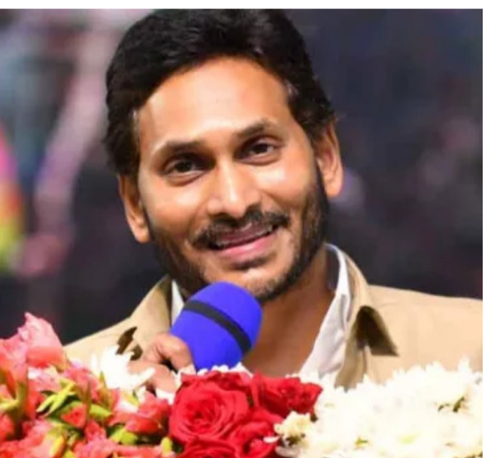
ద్వారా ఏడాదికి పదివేల అంద చేస్తున్నట్లు చెప్పారు. 2,75,931 మందికి 275.93

విజయవాడ: ప్రజాపాలన ప్రతినిధి: కురుక్షేత్రం యుద్ధం జరగబోతుందని సీఎం జగన్ అన్నారు. ఐదో విడత వైఎస్సార్ వాహనమిత్ర నిధులను విజయవాడ లో జరిగిన ఒక కార్యక్రమంలో సీఎం జగన్ విడుదల చేశారు. 2,75,931 మందికి పది వేల చొప్పున 275.93 కోట్లను బటన్ నొక్కి లబ్ధిదారుల ఖాతాలో చేశారు. అనంతరం ముఖ్యమంత్రి మాట్లాడుతూ, పాదయాత్ర సందర్భంగా వాహన మిత్ర కష్టాలు తెలుసుకొని వాహన మిత్ర పథకాన్ని అమలు చేస్తున్నట్లుగా చెప్పారు. బతుకుబండి లాగడానికి ఇబ్బందిపడే ఆటో, ట్యాక్సీ డ్రైవర్లకు తమ ప్రభుత్వం అండగా ఉంటుందన్నారు. ఆటో, ట్యాక్సీ డ్రైవర్లకు ప్రతి ఏటా వాహనమిత్ర