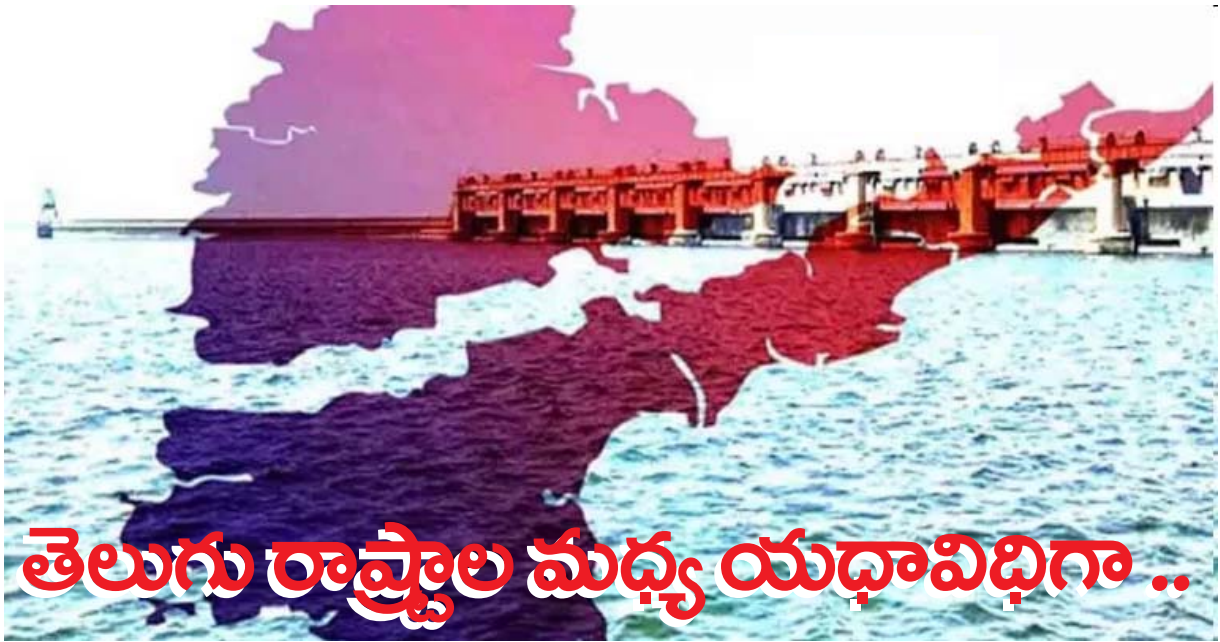
తెలుగు రాష్ట్రాల మధ్య యధావిధిగా..

అస్త్రశస్త్రాలను సిద్ధం చేసుకుంటున్న జగన్