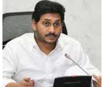
పోర్టులు, హార్బర్ల నిర్మాణ పనులపై జగన్ సమీక్ష

అనంతపురం : అనంతపురం నగర శివారులో నిర్వహిస్తున్న సూపర్ స్పెషాలిటీ- ఆసుపత్రి నిర్వహణ అస్తవ్యస్తంగా మారింది. పట్టించు కునే నాణ్యత లేక ఇబ్బరాజ్యంగా కొనసాగుతోంది. అయ్యో ఇదేమి విద్వారం అనే పరిస్థితి నెలకొంది. పట్టించుకోవాల్సిన అధికారులు నిద్ర వస్తాలో ఉండడంతో కనీసం వసతులు లేకుండా నెట్టుకొచ్చే దుస్థితి దాపురించింది. దీనికి కారణం ఎవరు అనే ప్రశ్న కేవలం ప్రశ్న గానే మిగిలిపోతుంది. దీనికి సమాధానం చెప్పే అధికారులు కూడా కరవైన దుర్బర స్థితి. రోగులకు మెరుగైన వైద్య సేవలు అందించాలన్న లక్ష్యంతో అనంతపురం నగర శివారులో ప్రతిష్టాత్మకంగా ఏర్పాటు చేసిన సూపర్ స్పెషాలిటీ ఆసుపత్రిలో వసతులు పూర్తిగా కనుమరుగవు తున్నాయి. కనీసం ఏసీలు కూడా పనిచేయని డౌర్బాగ్య పరిస్థితిలో ఆసుపత్రి నిర్వహణ కొనసాగు తోంది. అంత పెద్ద ఎత్తున ఏర్పాటు చేశామని డబ్బాలు కొట్టుకున్న వసతులు లేకపోవడంతో అక్కడ ప్రభుత్వ పనితీరు ప్రస్తుతం జరుగు తున్న అంశానికి సంబంధించి పూర్తి భిన్నంగా మారిపోయింది. ప్రతివారం 12 వరకు ఆపరేషన్లు చేసే పేద ప్రజలకు అందగా నిలుస్తున్న సూపర్ స్పెషాలిటీ పనిచేయని డౌర్బాగ్య పరిస్థితిలో ఆసుపత్రి నిర్వహణ కొనసాగు తోంది. అవరేషన్ థియేటర్లో కనీస ప్రభుత్వ వైద్యశాలలు ఆసుపత్రిలు అధికారుల వర్ణనాతీతం నే మార్చిస్తాయిలో నక్రమంగా కొనసాగుతాయి ఇక్కడ కనీస వర్ణవేక్షణ లేకపోవడంతో ఇష్టానుసారంగా వ్యవహారం కొనసాగుతోంది వర్ణవేక్షణ లేకపోవడంతో అడిగే వారు లేక ఎటు- చూసినా నిర్లక్ష్యం తాండవిస్తోంది. (మిగతా 2లో..)