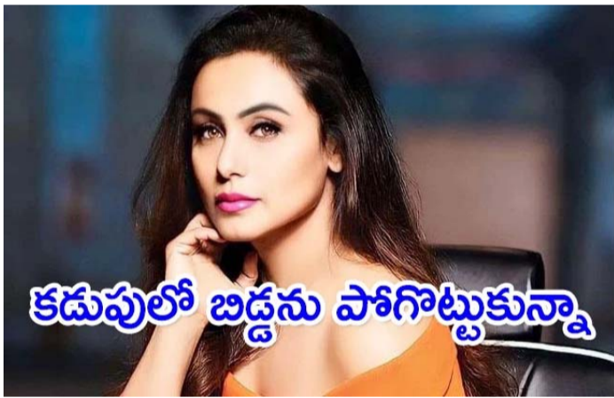
కడుపులో బిడ్డను పోగొట్టుకున్నా

బాలీవుడ్ స్టార్ హీరోయిన్ రాశీ ముఖర్జీ తన జీవితంలోని చేదు అనుభవాన్ని పంచుకుంది. కోవిడ్ నమయంలో కడుపులో బిడ్డను పోగొట్టుకున్నానని వెల్లడించింది.