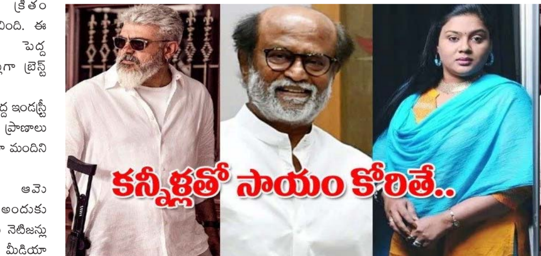
కన్నీళ్లతో సాయం కోరితే..