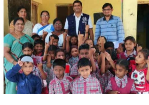
లు పాట శాలఉపాధ్యాయ సిబ్బంది పాల్గొన్నారు