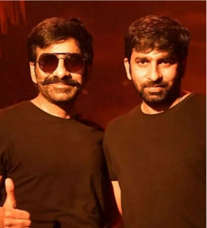
వీరసింహారెడ్డి తో సాలిడ్ హిట్ లో రవితేజ అమర్ అక్బర్ ఆం టోనీ చేసి డిజాస్టర్ ఇచ్చారు. ఇప్పుడు గోపీచంద్ తో కలిసి సూపర్ హిట్ ఇవ్వడానికి సిద్ధమయ్యారు.

ఇప్పుడు మరోసారి ఇద్దరు జోడీ కడుతున్నారు. మైత్రీ మూవీ మేకర్స్ ఈ చిత్రాన్ని భారీ బడ్డెట్ తో నిర్మించబోతోంది. ఈ సినిమాకి కూడా యాక్షన్ బ్యాక్ డ్రాప్ లోనే రియల్ ఇన్ఫిడెంట్స్ బేస్ చేసుకొని ఫిక్షనల్ లైన్ లో గోపీచంద్ మలినేని సిద్ధం చేసుకున్నారు. మే 7 లేదా 17 తేదీలలో మూవీ షూటింగ్ స్టార్ట్ కాబోతోందని తెలుస్తోంది. ఈ చిత్రంలో వ్యూణాల్ ఠాకూర్ రవితేజకి జోడీగా మైసల్ అయినట్లు టాక్. ఇక షూటింగ్ స్టార్ట్ చేసి రెగ్యులర్ షూట్ కి వెంటనే వెళ్ళబోతున్నారంటుంది. అలాగే 2024 మేలో రిలీజ్ లక్ష్యంగా సినిమాని కంప్లీట్ చేయాలని అనుకుంటున్నారంటుంది. ఈగల్ మూవీ షూటింగ్ కూడా ఇప్పటికే చాలా వరకు కంప్లీట్ అయినట్లు తెలుస్తోంది. త్వరలో ఈ చిత్రానికి సంబంధించి పూర్తి సమాచారం బయటకొచ్చే ఛాన్స్ ఉంది. గోపీచంద్ మైత్రీ మూవీ మేకర్స్ కి ఈ ఏడాది